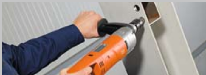
Poraa metallia nopeasti ja täydellisesti: Ei-rautametalleista ruostuneiden metallien kautta aina maalattuihin metalleihin.

Maailman ensimmäinen käsivarainen keernaporajyrssi, FEIN KBH 25, vakuuttaa täydellisillä poraustuloksilla. Mekaanisesti erittäin vakaiden koneenosien käyttö ja koneen vääntymätön kuppirakenne tarjoavat suurinta mahdollista tarkkuutta. Uudet käyttöaikaoptimoidut HM-keernaporat vakuuttavat laadukkailla paloillaan, jotka kestävät esiintyvää iskukuormitusta.